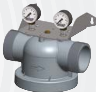
Equerre de fixation métallique (non incluse)